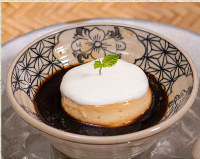
Bánh Flan Cà Phê Muối / Salted Coffee Cream Caramel