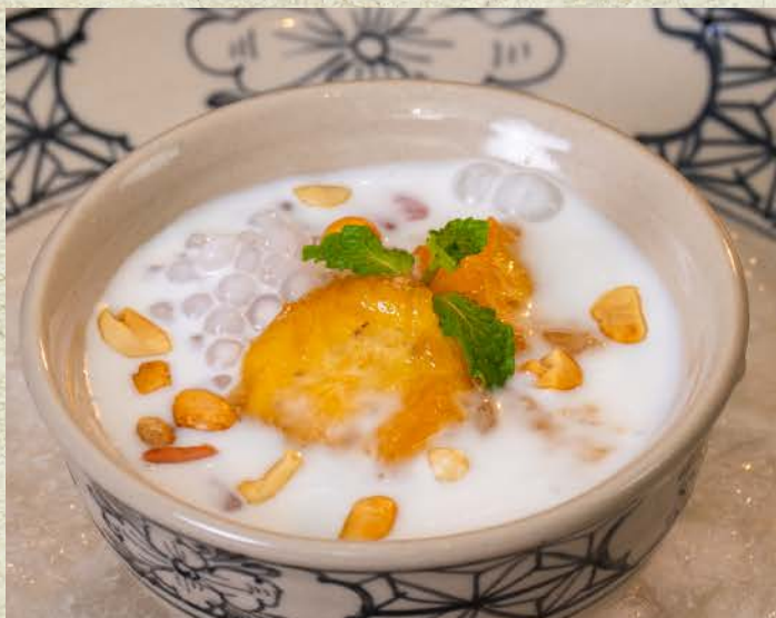
Chè Chuối Chưng Bột Báng / Banana Sweet Soup with Tapioca Pearls