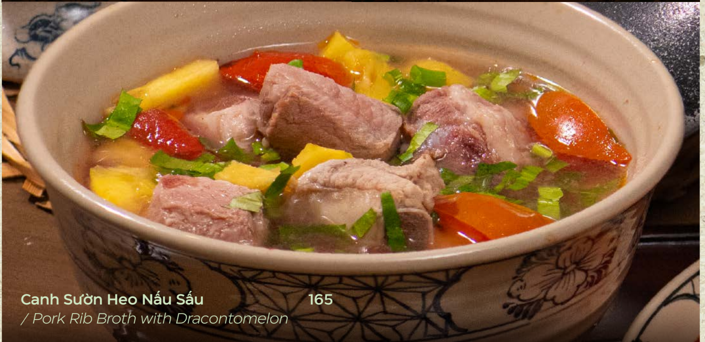
Canh Sườn Heo Nấu Sầu / Pork Rib Broth with Dracontomelon