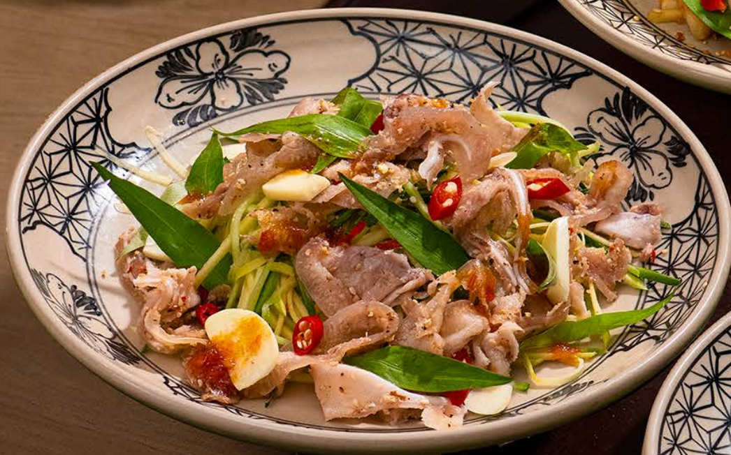
Gỏi Tré Trộn Xoài Xanh 145 / Green Mango Salad with Fermented Pork