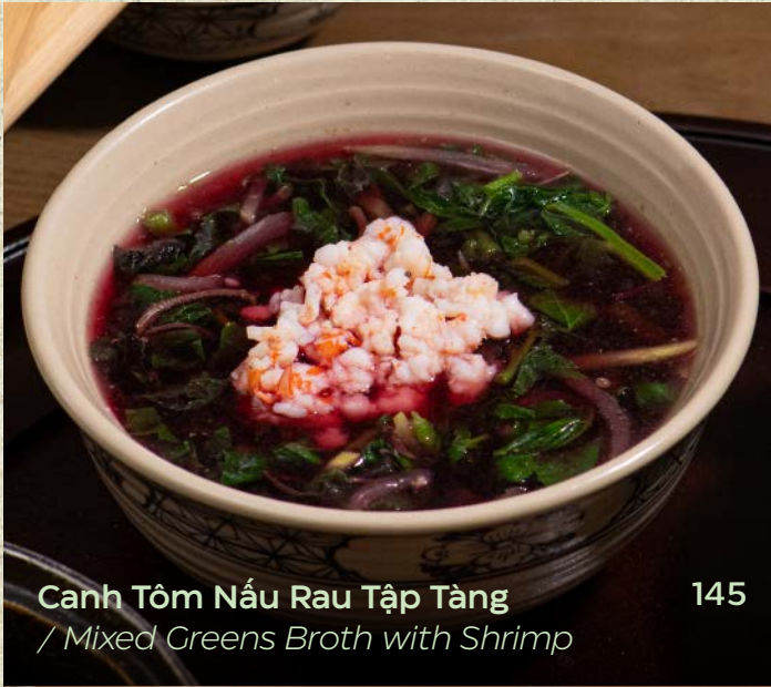
Canh Tôm Nấu Rau Tập Tàng / Mixed Greens Broth with Shrimp