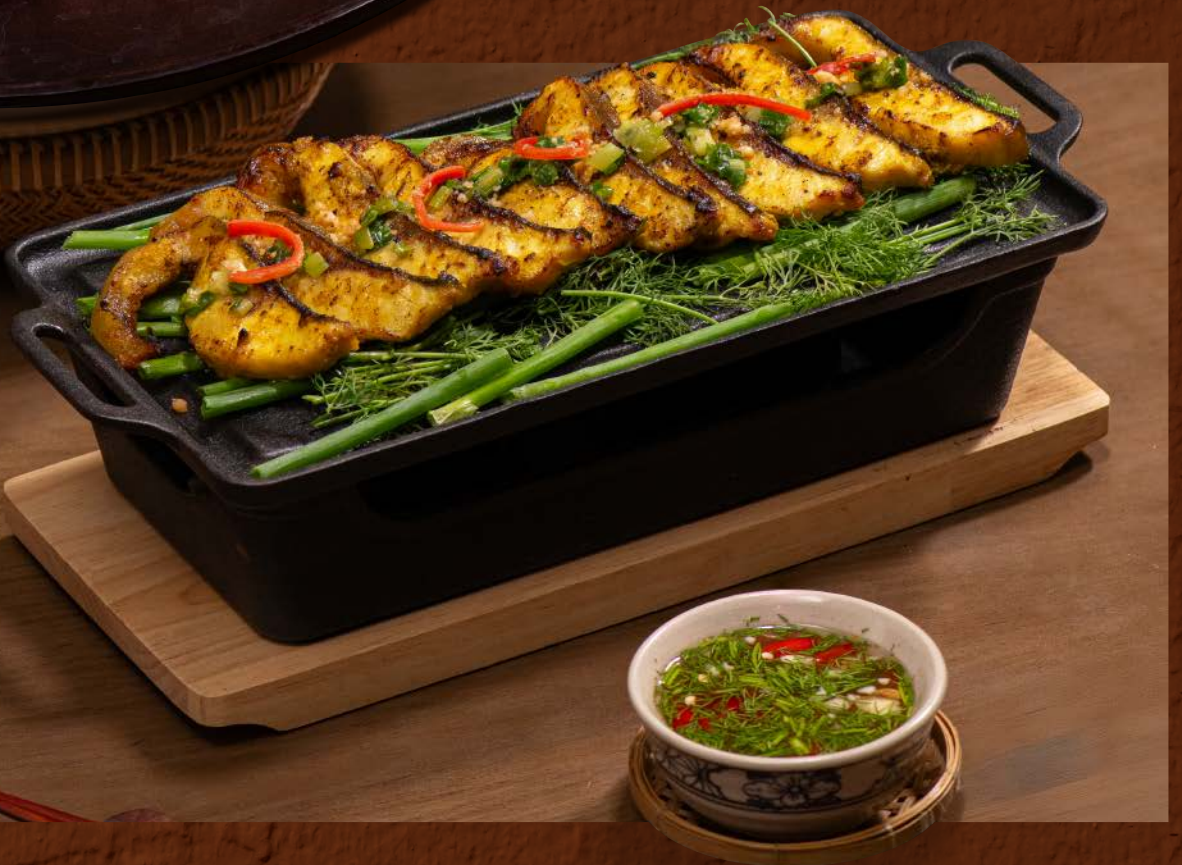
Cá Tầm Nướng Riềng Mè 385 / Grilled Sturgeon with Galangal & Fermented Rice