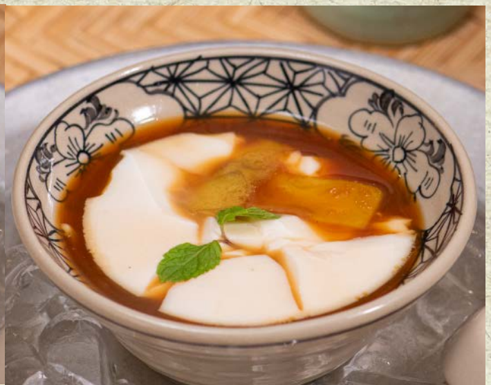
Tàu Hũ Non Đường Thốt Nốt / Steamed Young Tofu with Palm Sugar