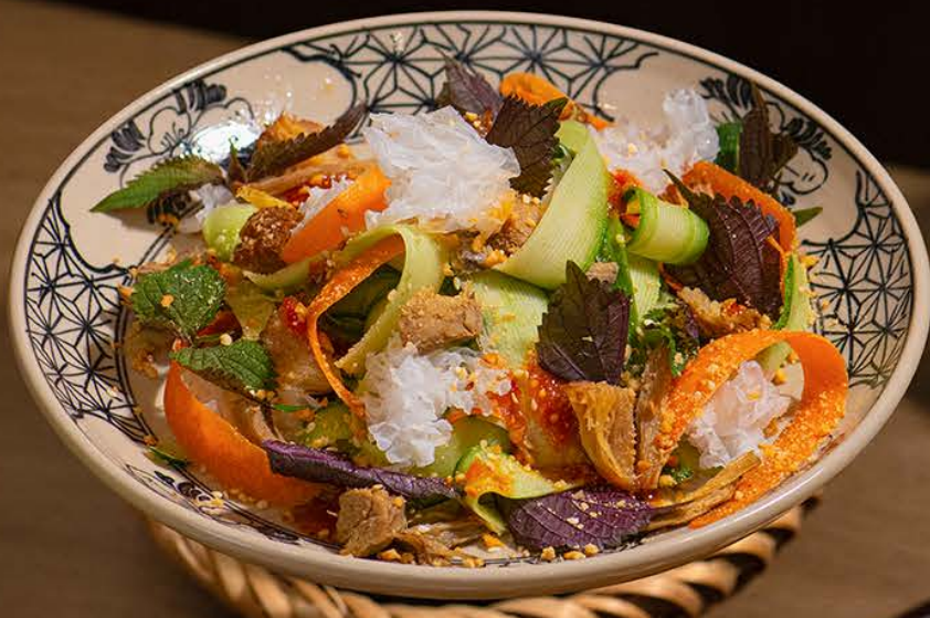
Gỏi Dưa Leo Váng Đậu 115 / Cucumber Salad with Tofu Skin