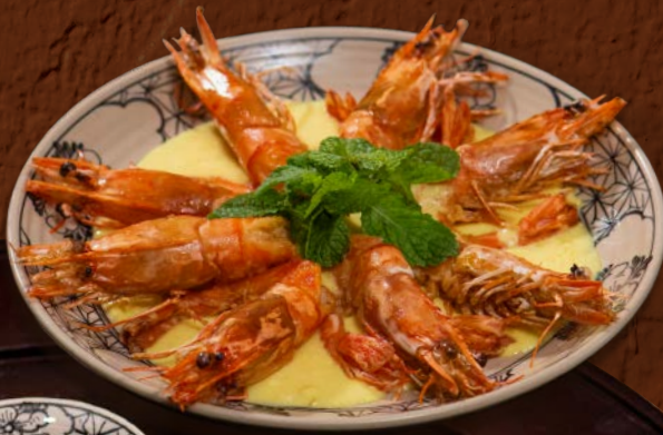
Tôm Sốt Bơ Tỏi 295 / Tiger Prawns in Garlic Butter