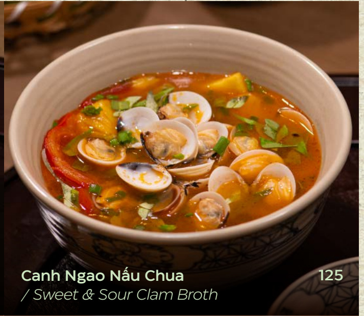
Canh Ngao Nấu Chua / Sweet & Sour Clam Broth