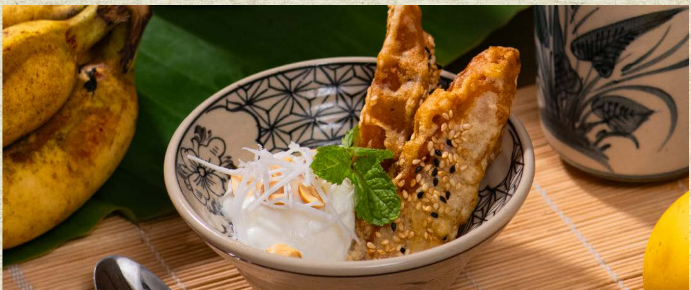
Chuối Chiên Kem Dừa / Fried Banana with Coconut Ice Cream