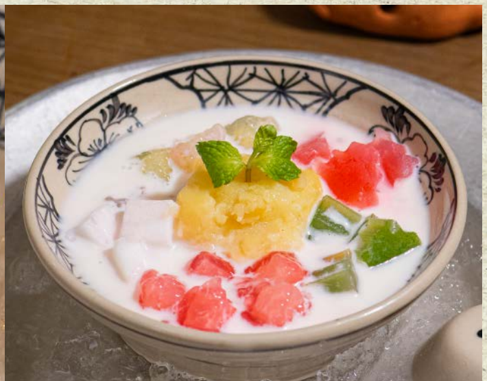
Chè Bột Lọc Sữa Dừa / Sweet Tapioca Pearls in Coconut Milk