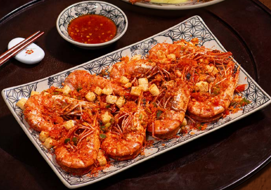
Tôm Sú Rang Muối Tây Ninh 295 / Salt-Roasted Tiger Prawns "Tay Ninh" Style