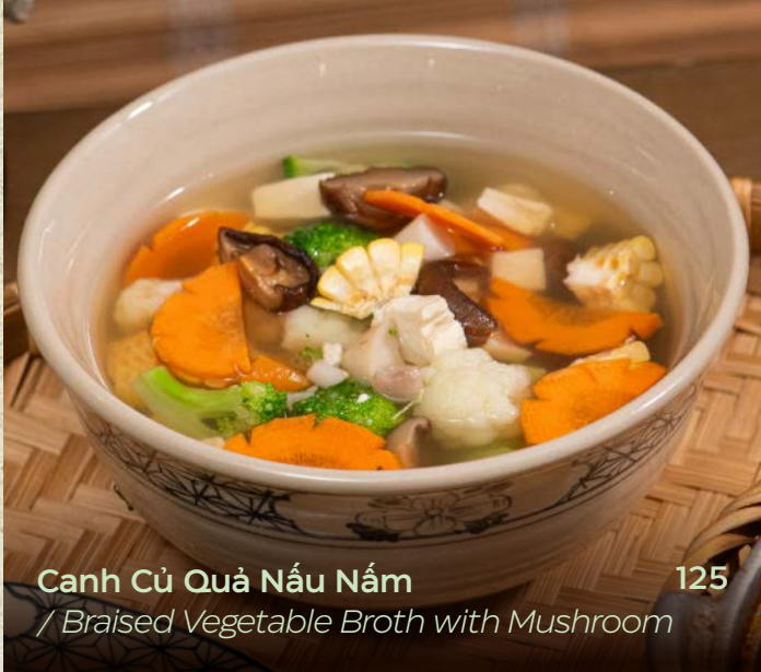
Canh Củ Quả Nấu Nấm / Braised Vegetable Broth with Mushroom