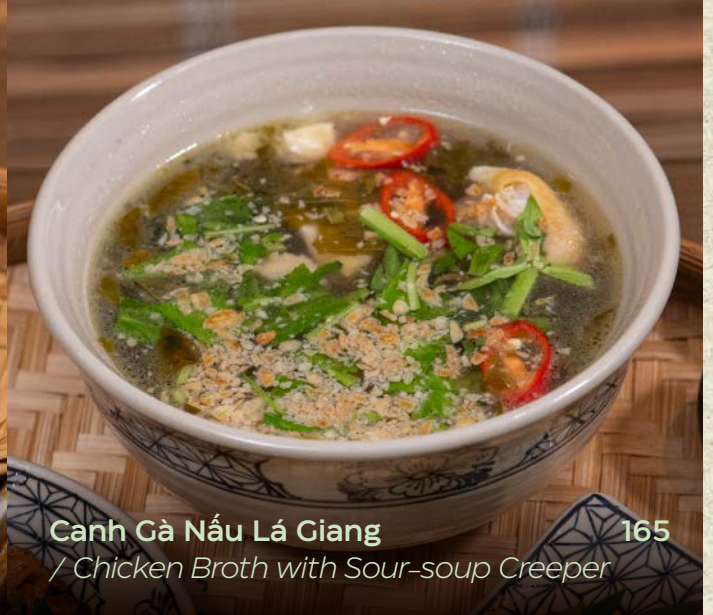
Canh Gà Nấu Lá Giang / Chicken Broth with Sour-soup Creeper